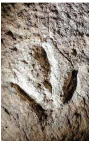
עקבה של דינוזאור בבית זית

זכות "פארק היורה" הדינוזאורים התגלו כאוצר בלום שהכניס למפיקים מיליארדים. פליאונטולוגים, חוקרי עולם החי הקדום, התייצבו באומץ לצד ארכיאולוגים הרפתקנים כאינדיאנה ג'ונס וסיכנו את נפשם למען היצורים הקדומים