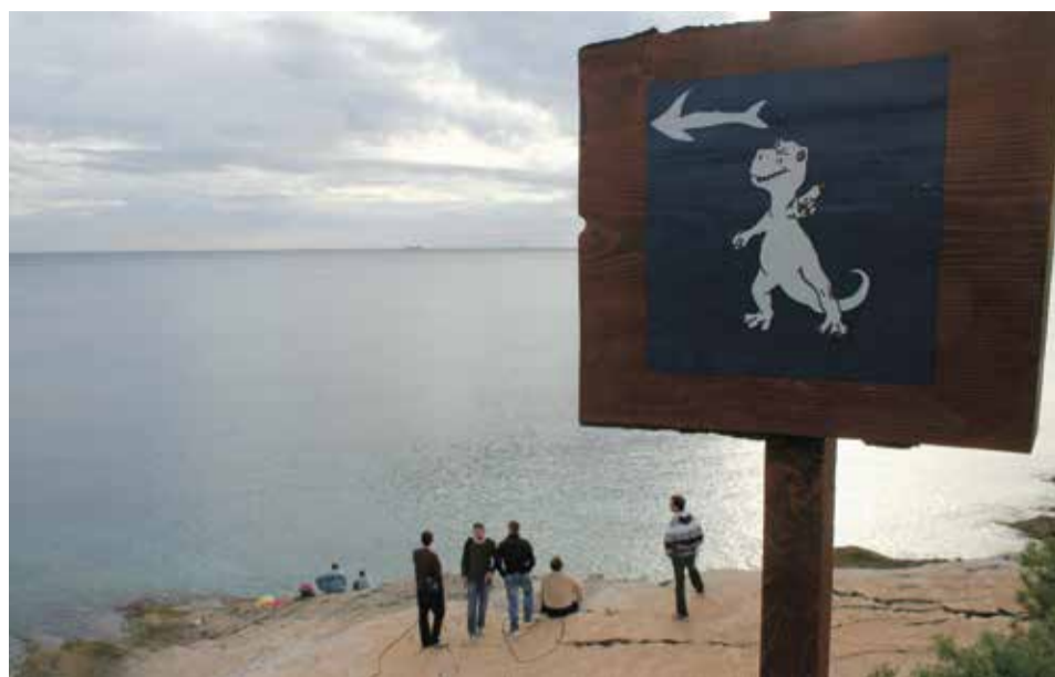
אתר שנמצאו בו עקבות דינוזאורים בקרואטיה. מאות אלפים מגיעים לחבל הנידח

אלא שלאחר שהסתיים החיפוש הזה אחר דינוזאורים ביש"ר ראל עולה מחשבה ברורה אחת – מדוע אין לנו מקבילה למחלקת הדינוזאורים הנפלאה ב"Natural History Museum בלונדון? שם יש בקומת הקרקע אגף שלם שמור קדש לדינוזאורים. מוצגים בו שלדי יצורים, שחזורים והדמיות מצוינות. האגף נחשב אחד הפופולריים ביותר בכל המוזיאון. מדוע אין מוזיאון טבע דומה בישראל, שמציג את העושר המקומי בממצאים הקדומים בצורה מסודרת? מדוע שהילדות מפארק הירקון לא יזכו להדרכה מדעית יותר? את המוזיאון הנכסף אפשר להקים במצפה רמון, על שפת המכתש, או בבית זית, לצד העקבות בני עש"רות מיליוני השנה. רק שיקום.