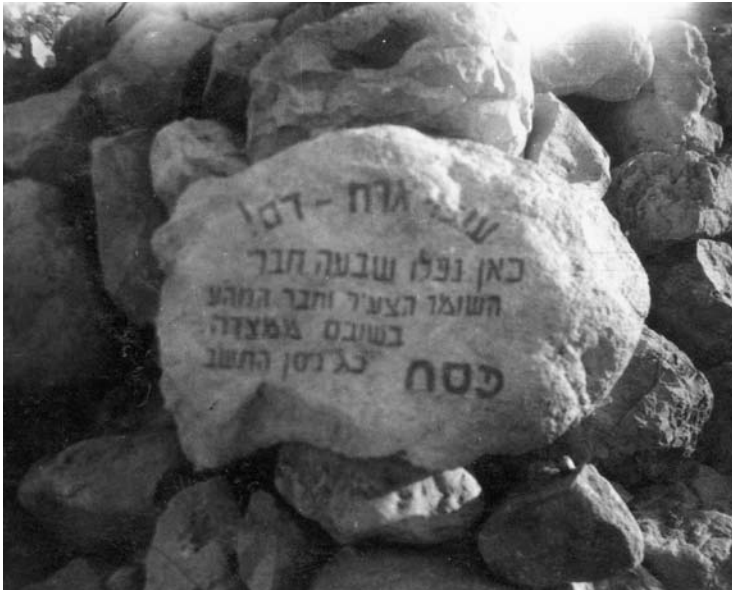
איור 8: אבן עם כתובת וזיכרון לחללי אסון הרימון שנקבעה בגל אבנים ליד תל גורן בעין גדי. שנה אחרי האסון הוחלפה בלוח שיש ואנדרטה

שנה אחרי האסון חזרו התנועות למדבר. 'המסע לא עמד מלכת!' נכתב על האנדרטה שהוקמה לזכרם (איור 8).