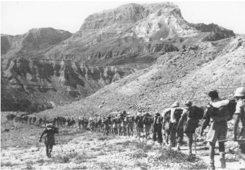
איור 9: מסע פלמ"ח בדרך למצדה.