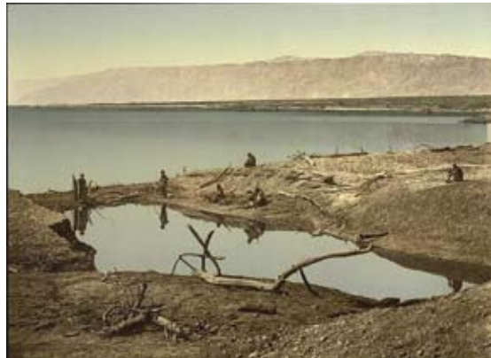
איור 3: החוף הצפוני של ים המלח צילום צבוע מראשית המאה העשרים