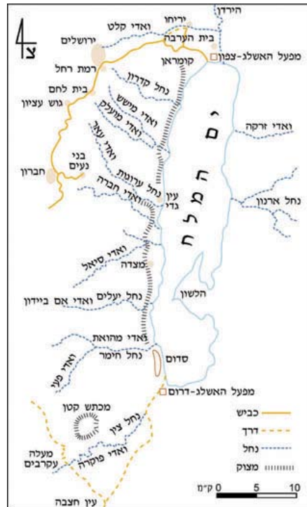
איור 1: מפת מדבר יהודה עם היישובים והדרכים בתחילת המאה העשרים

(מרס 1871) מירושלים ליריחו וים המלח, טיול שדמה, קרוב לוודאי, לזה שהונצח בציור משנות הארבעים של אותה מאה (איור 2). בדרכם חזרה מיריחו התרחשה דרמה נדירה. הם שבו בנתיב הדרומי, העולה לכיוון מנזר מרסבא ומשם לירושלים. סמוך לנבי מוסא עצרו שני צעירים, המתורגמן וילין עצמו, על