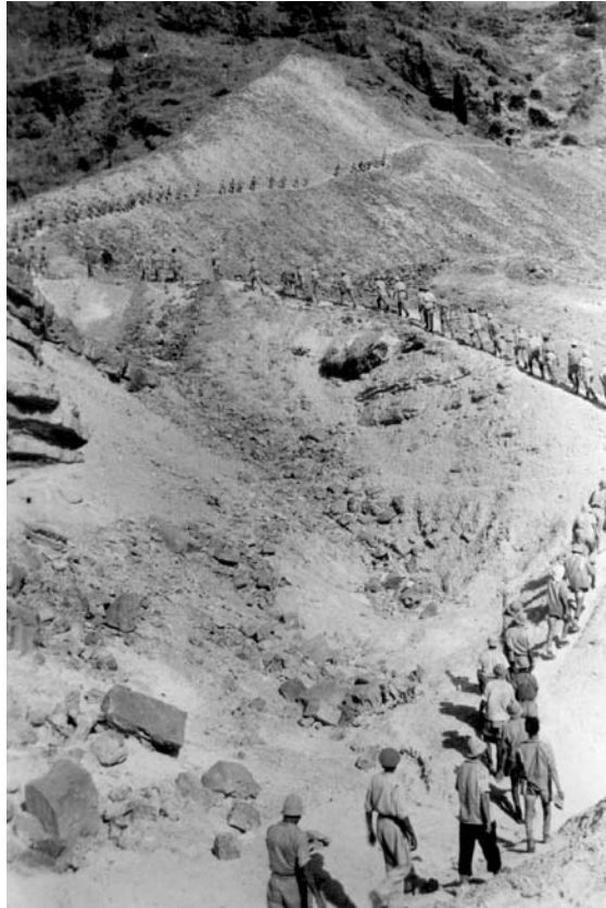
איור 10: מסע פלמ"ח מעפיל למצדה על גבי הסוללה