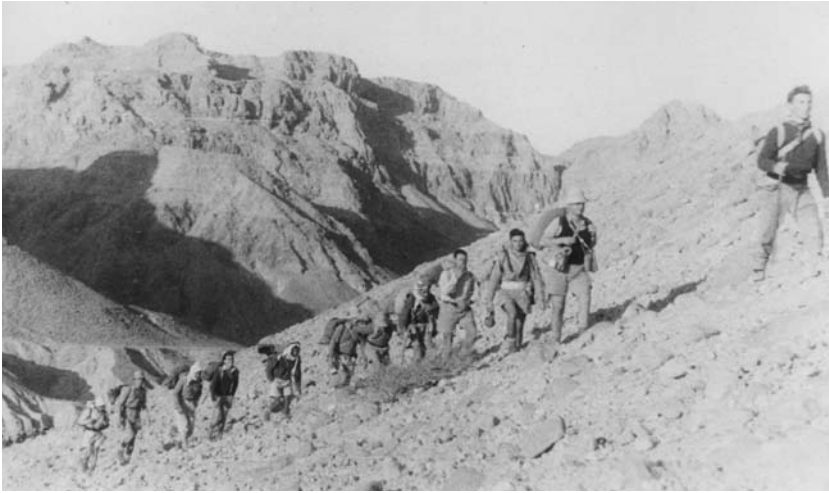
איור 11: סיירי פלוגה ה' בעלייה למצדה

באמצע שנות הארבעים נערכו עשרות מסעות של כל שמונה פלוגות הפלמ"ח, אך גם לא מעט גופים אחרים. חופשת פסח באפריל 1947 עוד נוצלה למספר מסעות, הן במדבר יהודה והן לאורך הערבה בנסיעה. בימים הבאים גבר המתח הביטחוני, טיולי המדבר פסקו, ובסופה של אותה שנה פרצה מלחמת העצמאות.