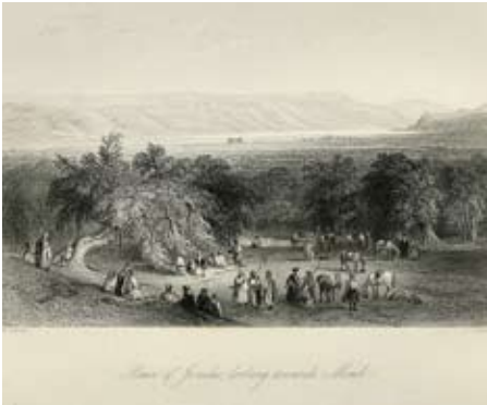
איור 2: קבוצת מטיילים בערבות יריחו 'צופה לעבר מואב'. תצלום של תחריט שהוכן על ידי בנטלי (J.C. Bentley) בעקבות ציור של ברטלט (W.H. Bartlett), שצויר בסביבות שנת 1840

מנת לעשן 'ציגרה', ואז מיהרו להשיג את השאר. אולם הם טעו בדרכם, איבדו את השביל ואת השיירה ותעו במשך יום ולילה במדבר. בפמליית התייר האמיד גילו, בעצירה ליד מר־סבא, את דבר היעדרם של השניים. החיפושים לא העלו דבר, והשיירה מיהרה לירושלים כדי להזעיק עזרה. בבוקר יצאו חיילים לחפשם. לאחר שעות מצאו שני חיילים את האובדים, ולירושלים הגיעה הידיעה באיתות בדגלים, מפסגה לפסגה: 'מצאנו את השניים בריאים ושלמים'.